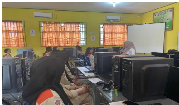
Gambar 3 Siswa Diberikan Kuesioner Sebelum Dilaksanakan Pelatihan

Pengabdian ini diikuti oleh 22 orang peserta yang merupakan siswa kelas XII jurusan akuntansi di SMKN 2 Mandau. Peserta sangat antusias dalam mengikuti pelatihan ini, mengingat pentingnya keterampilan MYOB dalam dunia kerja yang semakin digital. Melalui pelatihan ini, diharapkan para siswa tidak hanya memahami teori akuntansi, tetapi juga mampu mengaplikasikannya dalam situasi nyata menggunakan perangkat lunak MYOB. Pengalaman ini diharapkan dapat memberikan bekal yang berharga bagi siswa dalam menghadapi tantangan di dunia kerja nantinya.