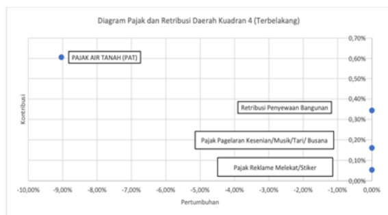
Gambar 5. Diagram Pajak dan Retribusi Daerah Kuadran IV

Menurut diagram di atas, pajak daerah Kota Bogor menghasilkan kontribusi komponen pajak tertinggi, yaitu pajak air tanah sebesar 0,61%, pajak pagelaran kesenian/musik/tari sebesar 0,16%, dan pajak reklame melekat/stiker sebesar 0,05%. Pertumbuhan komponen pajak tertinggi, yaitu pajak pagelaran kesenian/musik/tari dan pajak reklame melekat, adalah 0,00%, dan pajak air tanah adalah -9,04%. Jumlah kontribusi dan pertumbuhan pajak daerah di Kota Bogor kuadran IV secara rata-rata kontribusi sebesar 0,27% dan pertumbuhan sebesar -3,01%.