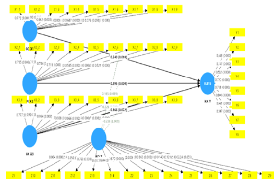
Gambar 2 : Convergent validity

individu dan konsep target lebih besar dari 0,7, maka korelasi tersebut dianggap tinggi. Sebaliknya, nilai 0,5 hingga 0,6 untuk outer loading sudah memadai, menurut Chin, sebagaimana dikutip oleh Ghazali (2015). Gambar berikut menunjukkan hasil analisis Convergent Validity :