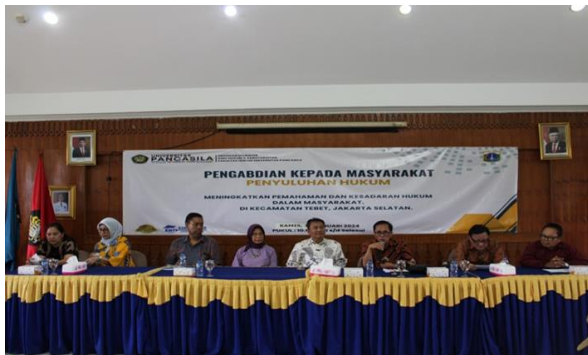
Gambar 1. menunjukkan aktivitas akademisi dari Universitas Pancasila

Berikut ini adalah dokumentasi kegiatan terkait kegiatan pengabdian kepada kelompok penenun di Kecamatan Tebet Kota Jakarta Selatan: