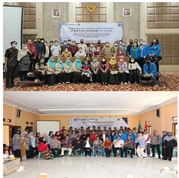
Gambar 2. Menunjukkan penutupan semua rangkaian kegiatan aktivitas akademisi dari Universitas Pancasila dalam penyuluhan hukum meningkatkan kesadaran hukum dalam masyarakat, di sesi akhir ini sebelum penutupan peserta diberikan kesempatan untuk bertanya yang akan dijawab oleh narasumber dari akademisi fakultas hukum universitas pancasila Jakarta.

Selama dan setelah penyuluhan hukum meningkatkan kesadaran hukum dalam masyarakat, penyuluhan ini sangat penting mengingat banyaknya masyarakat yang melanggar dan belum mengetahui tentang hukum.