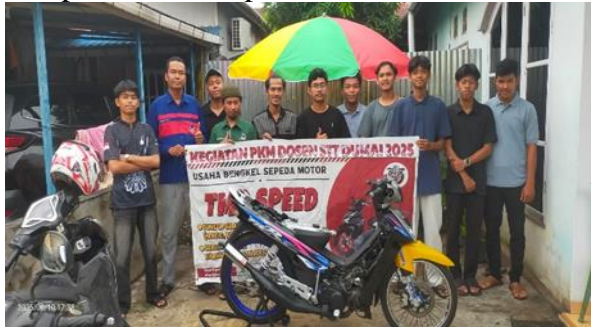
Gambar 1. Foto kegiatan PKM bersama Tim PKM ITB Riau Pesisir dan Peserta PKM

pelaksanaan program, observasi dan evaluasi. Metode yang diberikan pada pelaksanaan kegiatan ini adalah metode mentransfer ilmu pengetahuan dan teknologi kepada mitra sebagai upaya dalam membuka usaha bengkel(Suhardoyo et al. 2022). Trainer yang mengisi kegiatan bimbingan teknis dan pendampingan ini adalah Tim PKM dari dosen ITB Riau Pesisir yang memiliki kompetensi dan kepakaran.