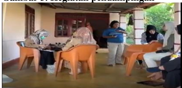
Gambar 3. Kegiatan pendampingan