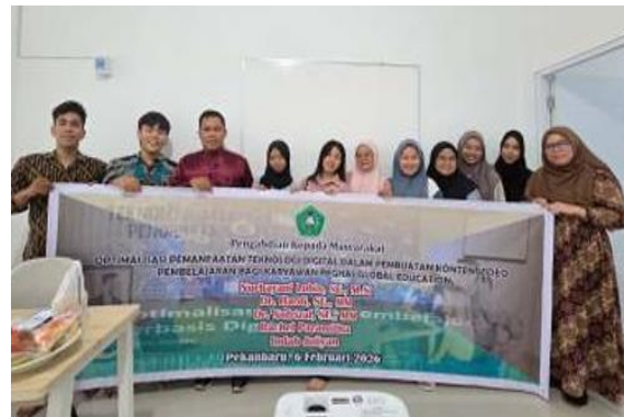
Gambar 3. Peserta Kegiatan Pengabdian Berfoto Bersama Tim Pengabdian

kegiatan, para peserta menunjukkan antusiasme yang tinggi, yang terlihat dari keaktifan mereka dalam mengikuti setiap sesi serta banyaknya pertanyaan yang diajukan terkait pembuatan dan pengembangan konten video pembelajaran. Partisipasi aktif peserta dalam diskusi dan sesi tanya jawab mencerminkan tingginya minat serta kebutuhan akan peningkatan kompetensi di bidang pemanfaatan teknologi digital dalam mendukung proses pembelajaran di PT Reghas Global Education.