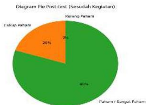
Gambar 5. Diagram Pie Post-test (Sesudah Kegiatan)

Terlihat porsi terbesar pada kategori Kurang Paham (50%), diikuti Cukup Paham (30%), dan Paham/Sangat Paham (20%).