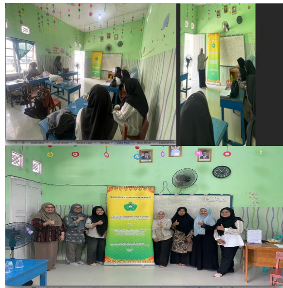
Gambar 1. Tim Pengabdian memberikan

Pengabdian Kepada Masyarakat ini dilakukan pada tanggal 7 Juli 2025 dan agenda kegiatan adalah Penguatan Kemampuan Pencatatan Keuangan Sebagai Penunjang Bisnis Pada SD IT Tahfidz Annur Al Fatih Pekanbaru. Acara bertempat di Sekolah Ji. Ketitiran, RW/RT. 01/03, Kel. Binawidya, Kec. Binawidya, Kota Pekanbaru dengan judul “Penguatan Kemampuan Pencatatan Keuangan Sebagai Penunjang Bisnis Pada SD IT Tahfidz Annur Al Fatih Pekanbaru”. Sebelum kegiatan penyampaian materi penjelasan mengenai persamaan dasar akuntansi hingga simulasi pencatatan laporan keuangan sederhana ,tim dosen memberikan kuesioner untuk mengukur tingkat pemahaman mengenai materi persamaan dasar akuntansi hingga simulasi pencatatan laporan keuangan sederhana yang akan diberikan pada saat pengabdian ini.