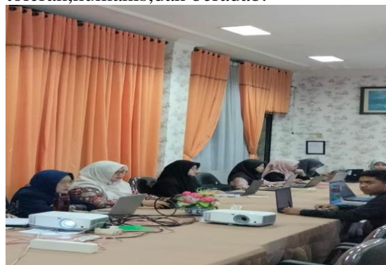
Gambar 1. Penyampaian materi oleh narasumber

mengenai dampak hukum dari perilaku intoleransi dan bullying , serta minimnya kesadaran tentang penghormatan terhadap hak asasi manusia dan keberagaman budaya. Selain itu, kultur senioritas yang dinormalisasi sebagai tradisi kampus juga menjadi hambatan signifikan. Kurangnya edukasi preventif tentang peran mahasiswa sebagai agen perubahan sosial serta ketakutan korban dan saksi untuk melaporkan kekerasan karena tekanan sosial memperparah situasi. Selain itu, penggunaan media sosial yang memicu cyberbullying dan ujaran kebencian semakin meningkat. Oleh karena itu, permasalahan-permasalahan tersebut menunjukkan pentingnya pelaksanaan program pengabdian kepada masyarakat yang membutuhkan program edukasi hukum dan penguatan kesadaran sosial untuk menciptakan budaya kampus yang toleran, humanis, dan beradab.