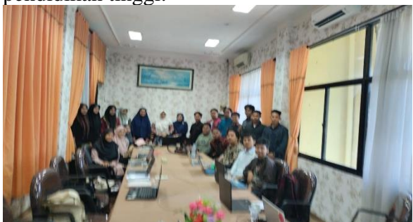
Gambar 4. Foto Bersama Peserta

Pendekatan edukatif dilakukan agar mahasiswa menunjukkan kesiapan untuk menjadi agen perubahan dalam menyebarkan nilai-nilai toleransi dan kesadaran hukum kepada teman sebaya. Dan mediator sosial dalam menciptakan lingkungan kampus yang aman dan inklusif serta menunjukkan bahwa pendekatan edukasi berbasis partisipasi mahasiswa efektif dalam membangun budaya hukum yang lebih progresif di lingkungan pendidikan tinggi.