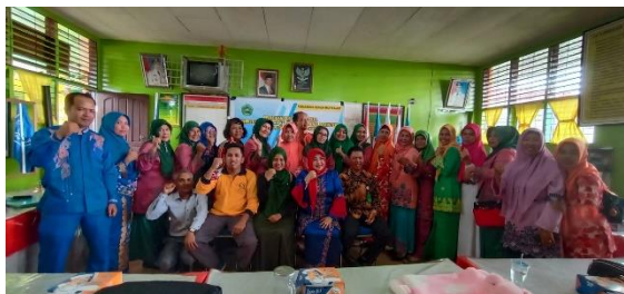
Gambar 7: Sesi Foto Diakhir Pelatihan