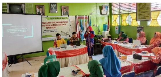
Gambar 1 Kepala Sekolah Memberikan Sambutan