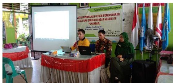
Gambar 2 Suasana Pemaparan Materi

Pada proses tanya jawab, majelis guru memberikan pertanyaan seputar kesulitan para guru memahami proses dalam pengoperasian Microsoft Word, Excel dan Powerpoint.