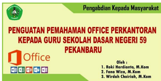
Gambar 6: Spanduk Pelatihan