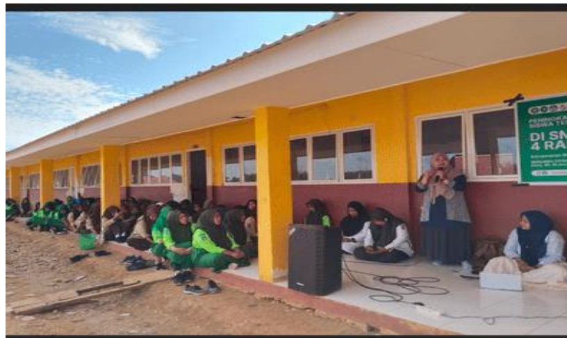
Gambar 10. Pemaparan Materi PKM