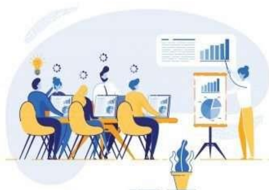
Gambar 2. Contoh Bentuk Penyuluhan Perpajakan

Dalam kegiatan ini, mitra akan diberikan materi terkait dengan cara peraturan perpajakan, kegiatan ini dilakukan selama 1 kali.