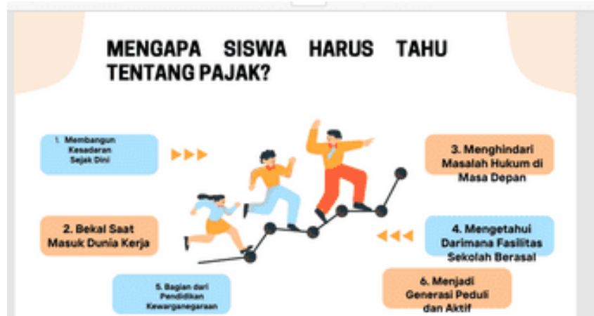
Gambar 9. Materi PKM.