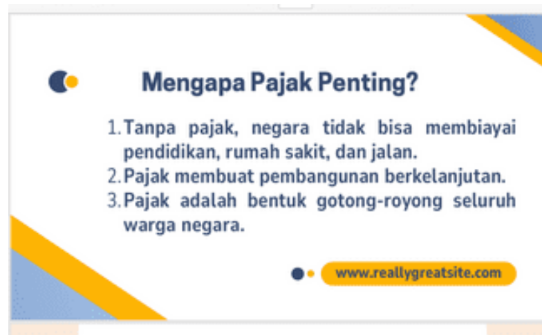
Gambar 8. Materi PKM