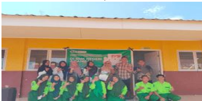
Gambar 11. Foto Bersama