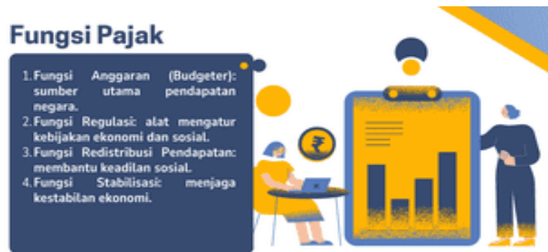
Gambar 5. Materi PKM