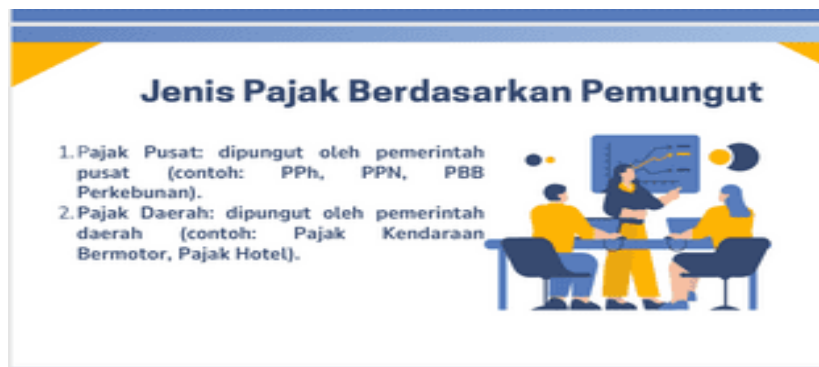
Gambar 6. Materi PKM