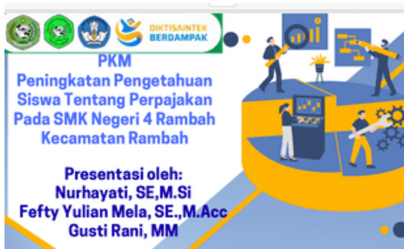
Gambar 3. Materi PKM