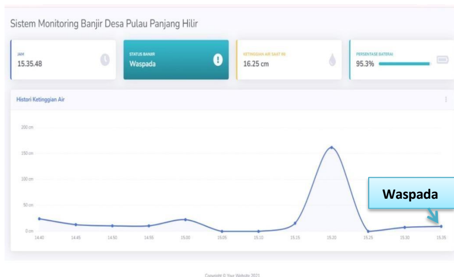
Gambar 5. Hasil Pengujian Pembacaan Sensor level Yang Ditampilkan Pada Website Dengan Status Waspada

Adapun hasil IoT tampilan website dapat di lihat pada Gambar 5. Dalam gambar tersebut terlihat bahwa kondisi waspada, bila dalam kondisi siaga ataupun bahaya akan berubah warna. Dan website dapat di pantau melalui https://monitoringbanjir.online .