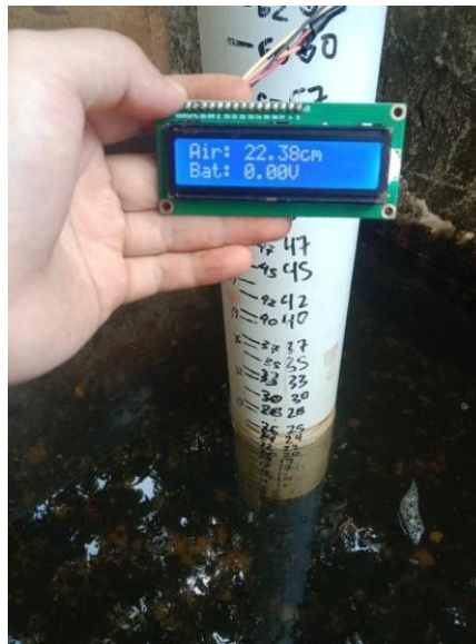
Gambar 4. Pengujian sensor level