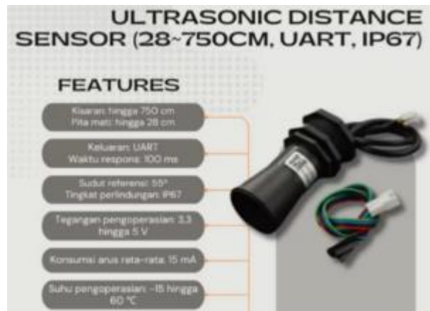
Gambar 2. Sensor Ultrasonik

Sensor yang memiliki jangkauan bacanya hingga 7 meter sehingga sensor ini bisa terpakai dengan artian untuk kenaikan air sungai tidak lebih dari 7 meter, dengan pengalaman banjir di desa Pulau Panjang Hilir dengan kenaikan airnya tidak sampai 7meter dari kondisi permukaan air normal maka sensor ini dapat di pakai. Berdasarkan data kenaikan air sungai di desa Pulau Panjang Hilir paling tinggi berkisar antara 4 – 5 Meter. Data dari sensor ini nantinya akan diolah oleh mikronktroller dengan jenis esp 32.