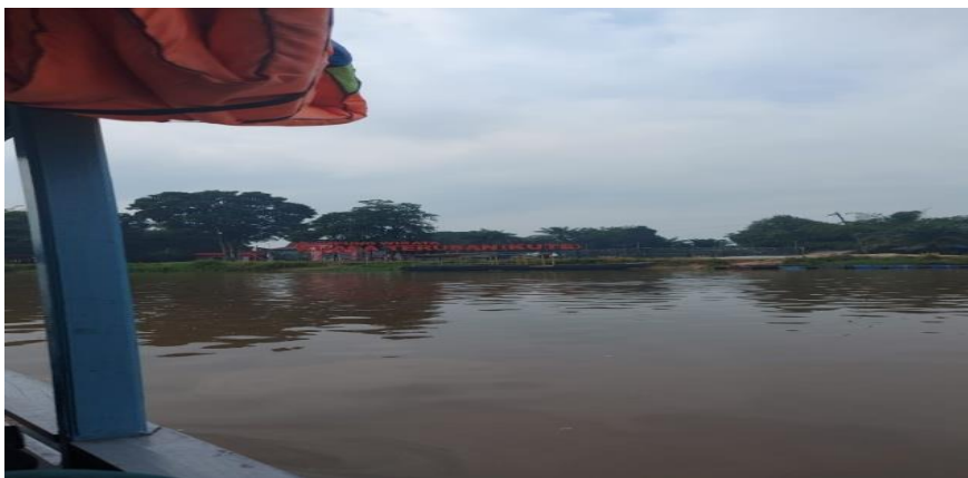
Gambar 1. Transportasi air menuju Desa Kuala Terusan

Oleh karena itu diperlukan usaha untuk meningkatkan pengetahuan masyarakat tentang perilaku hidup bersih dan sehat. Tujuan pengabdian kepada masyarakat ini adalah untuk meningkatkan pengetahuan masyarakat tentang perilaku hidup bersih dan sehat (PHBS) khususnya khususnya di desa Kuala Terusan Pangkalan Kerinci Pelalawan.