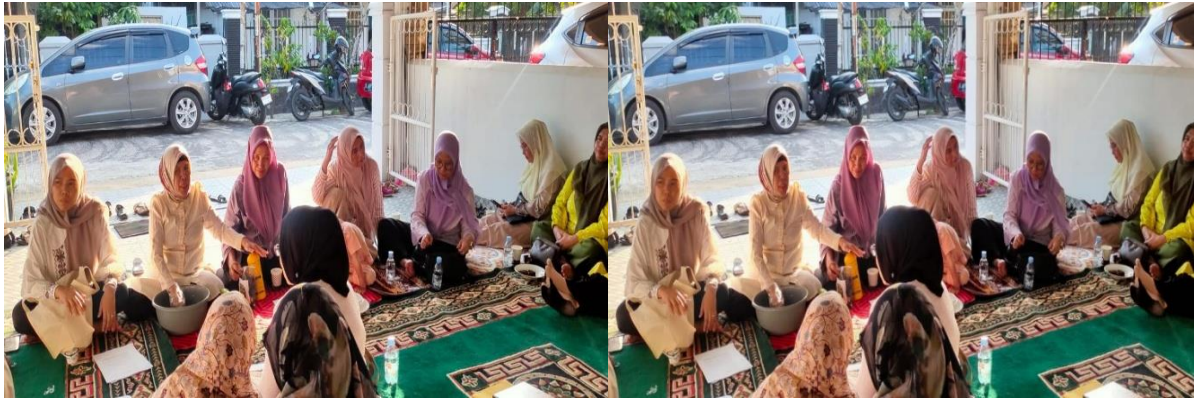
Gambar 2. Pembekalan Materi

Implementasi dimulai dari pembekalan materi (pentingnya lingkungan, dampak pembakaran sampah, serta manfaat kompos). Peserta antusias dan banyak bertanya pada sesi diskusi. Sebelum pembekalan, peserta mengisi kuesioner pre-test.