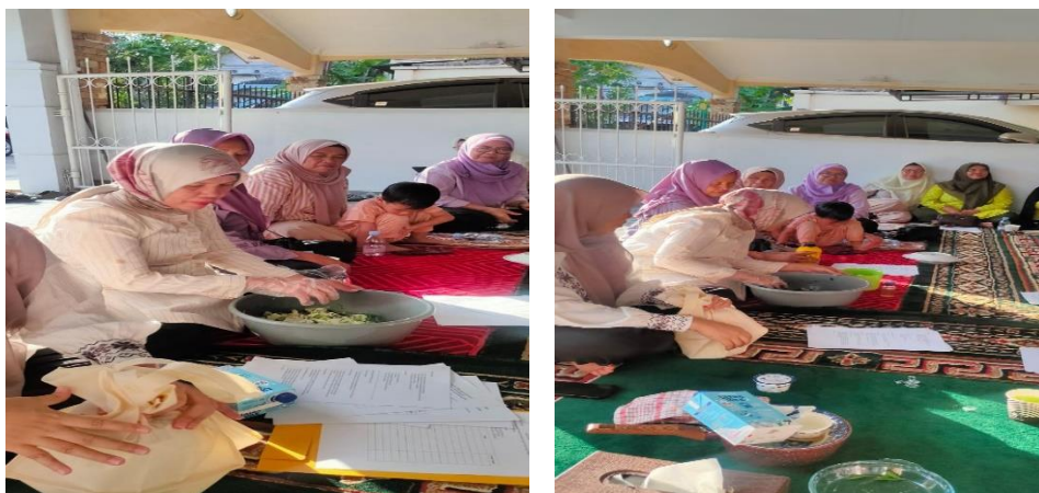
Gambar 3. Persiapan Pembuatan Kompos

Berdasarkan data kuesioner, sebelum kegiatan 100% peserta mengetahui kompos tetapi tidak tahu cara membuatnya. Setelah kegiatan, 100% peserta mengetahui cara membuat kompos. Hasil pengukuran pengetahuan peserta sebelum dan sesudah pembekalan materi ditunjukkan pada Tabel 1.