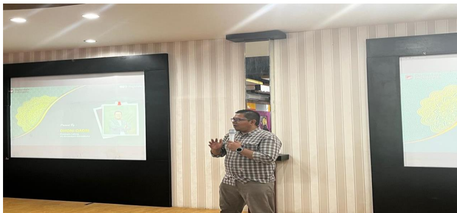
Gambar 3. Penyampaian Materi oleh Narasumber Pegadaian Syariah tentang Produk Investasi Digital

Keberhasilan program pendidikan ini didasarkan pada strategi penyatuan yang seimbang antara pengetahuan teoritis dan keterampilan praktis di bidang digital. Kerjasama antara STIE Riau dan Pegadaian Syariah memungkinkan penyampaian materi yang tidak hanya mendalam dalam konsep keuangan syariah sesuai dengan prinsip maqashid syariah, tetapi juga disertai dengan demonstrasi langsung dalam penggunaan platform dan aplikasi investasi syariah secara digital. Peserta tidak hanya mempelajari teori di balik produk seperti Tabungan Emas dan Rahn Syariah, tetapi juga diajak untuk melakukan simulasi transaksi dalam lingkungan yang aman. Metode blended learning ini memastikan bahwa pengajar dan mahasiswa sebagai calon agen perubahan dapat menginternalisasi nilai-nilai syariah sekaligus menguasai kompetensi teknis yang dibutuhkan dalam era keuangan digital.