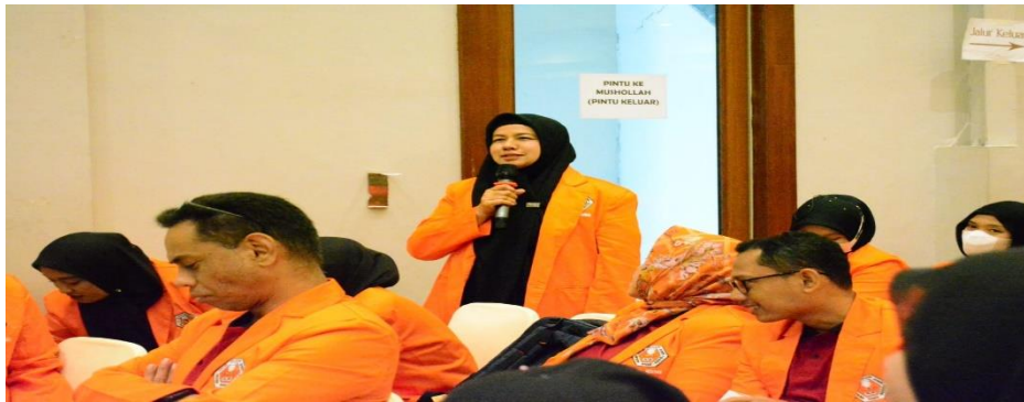
Gambar 4. Sesi Tanya Jawab Interaktif antara Peserta dan Narasumber

Keberhasilan suatu program edukasi dapat dilihat dari partisipasi aktif audiens. Hasil observasi menunjukkan antusiasme dan interaksi yang tinggi dari para peserta selama ketiga siklus kegiatan.