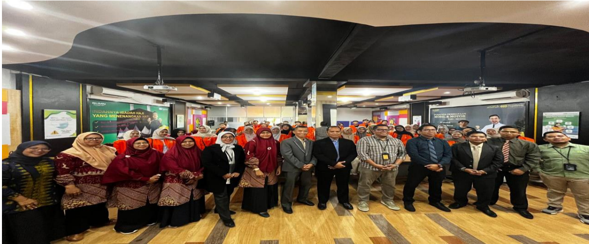
Gambar 2. Acara Seremonial Pembukaan dan Penandatanganan MoU antara STIE Riau dan Pegadaian Syariah Cabang Sudirman Pekanbaru

Kolaborasi ini dimulai dengan komitmen formal untuk memastikan keseriusan dan kejelasan peran masing-masing pihak